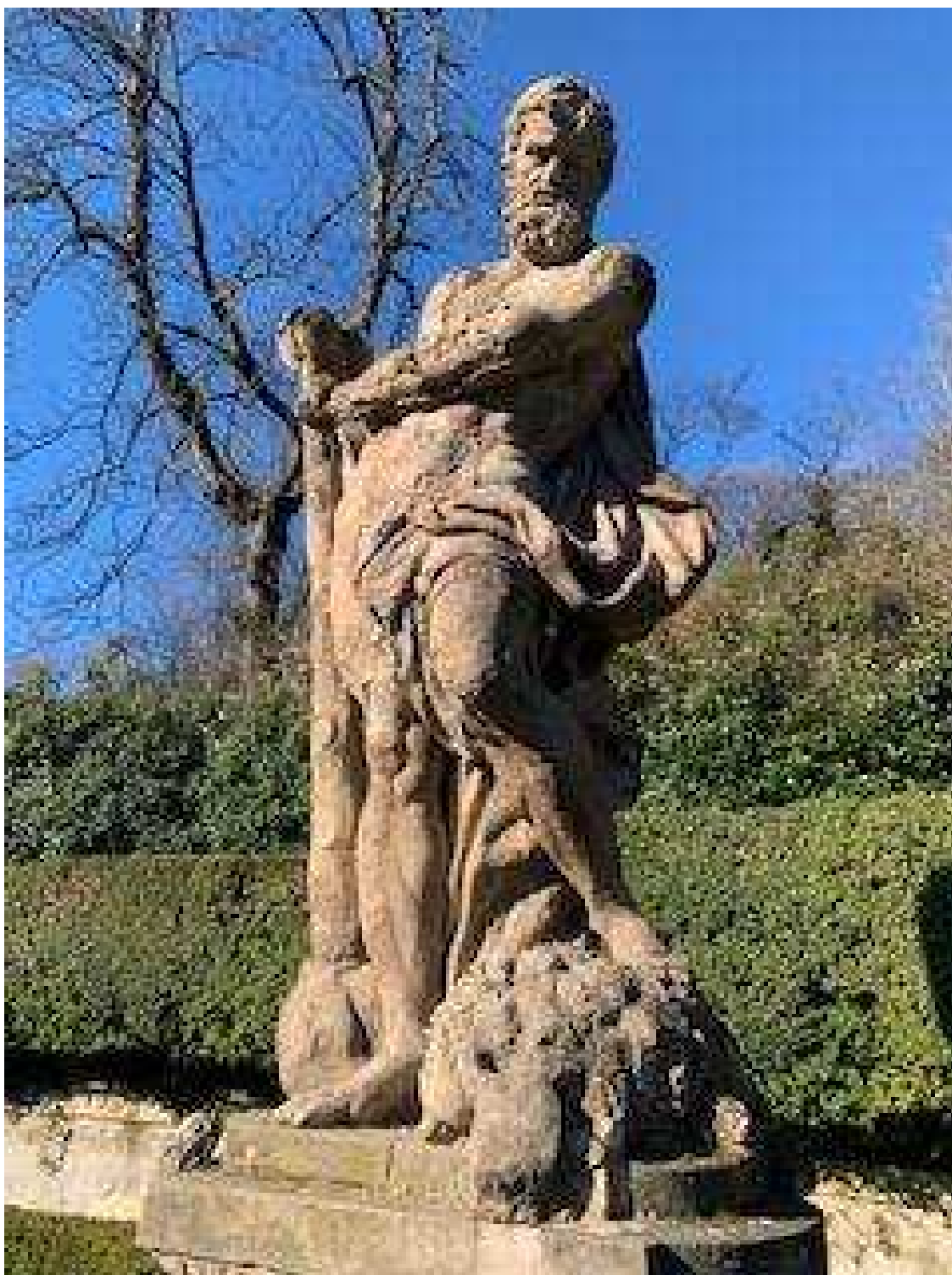
Statua di Ercole