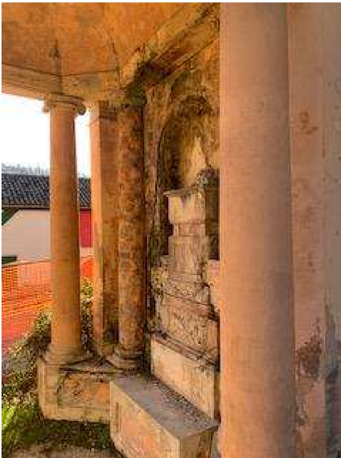
Edicola Monumento al Cane