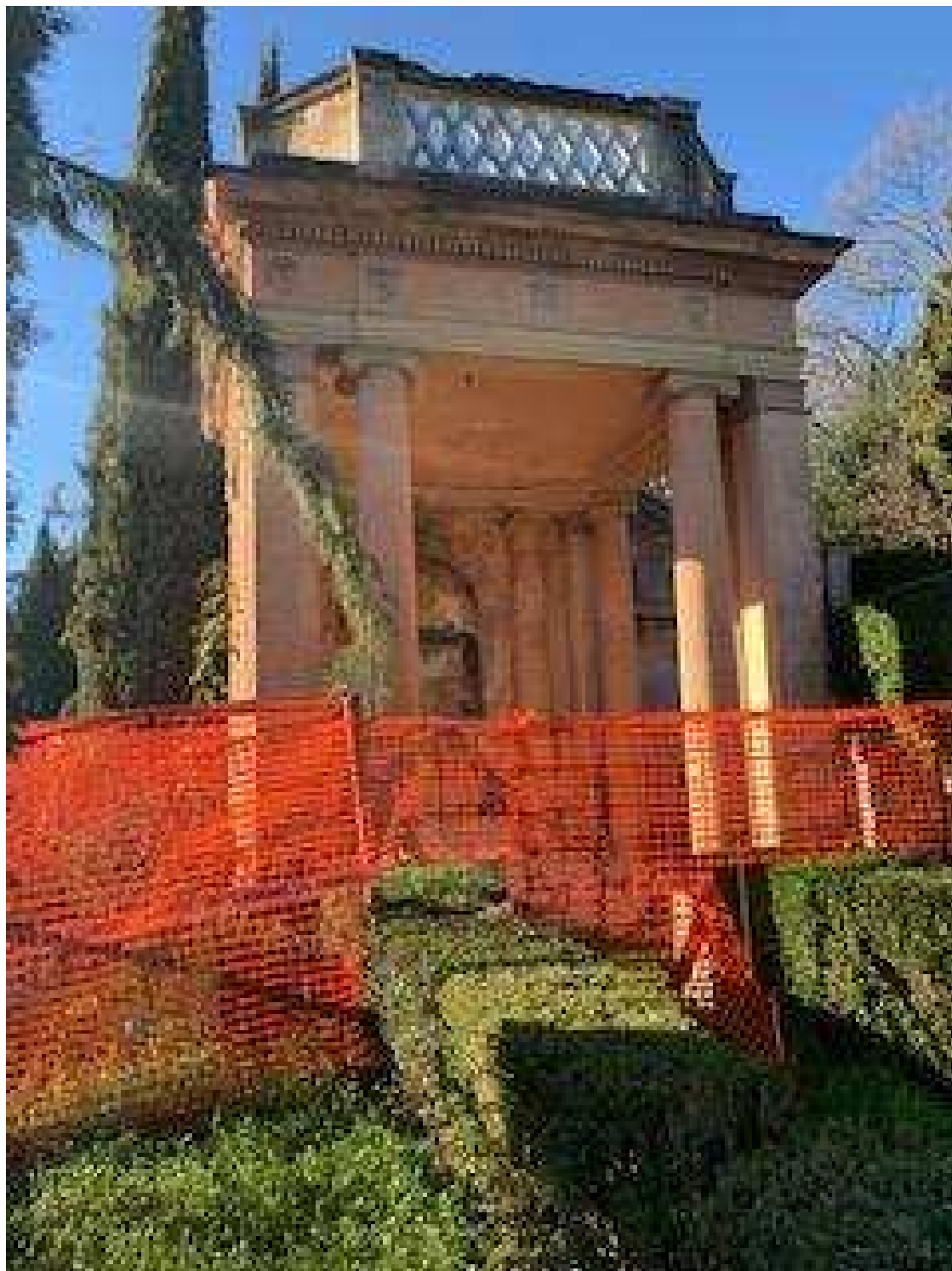
Prospetto Nord Monumento al Cane