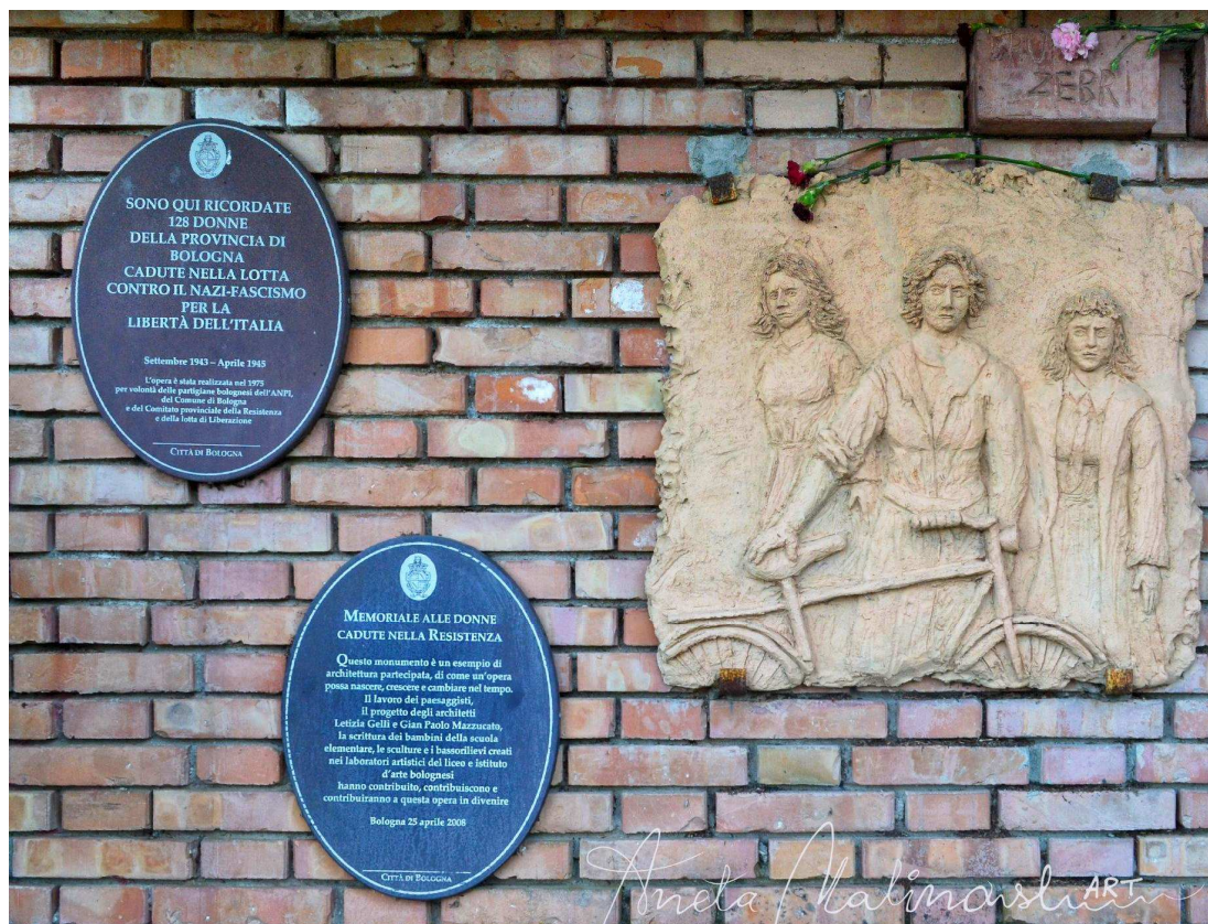
Monumento alle partigiane_2