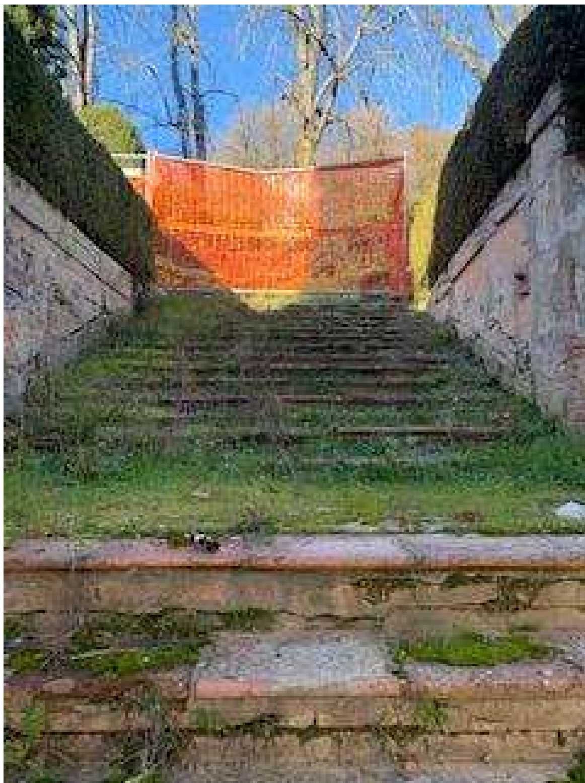
Scala di accesso al tempio