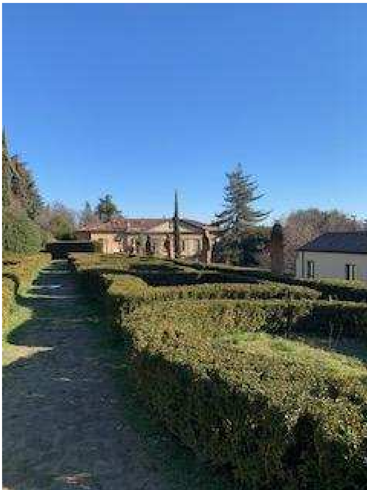
Scorcio del giardino all'italiana