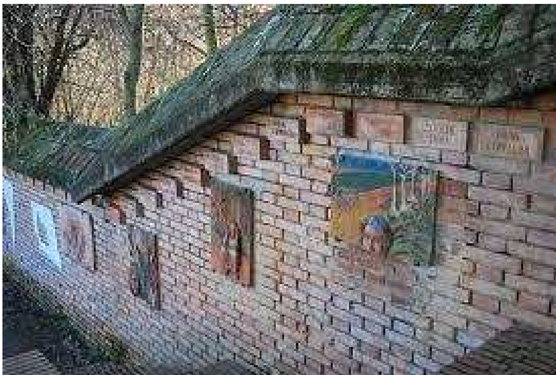
Monumento alle partigiane_1